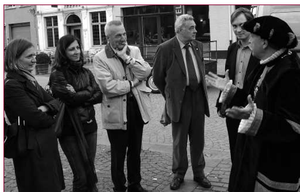
Europese genodigden op onze denktank:

In navolging van deze geslaagde denktankontmoeting zal tegen februari 2008 een subsidiedossier ingediend worden bij de Europese Commissie onder het 'Europe for Citizens' programma. Hiermee willen we Europese financiële steun vragen voor de organisatie van deze Europese conferentie over de rol van erfgoedverenigingen.